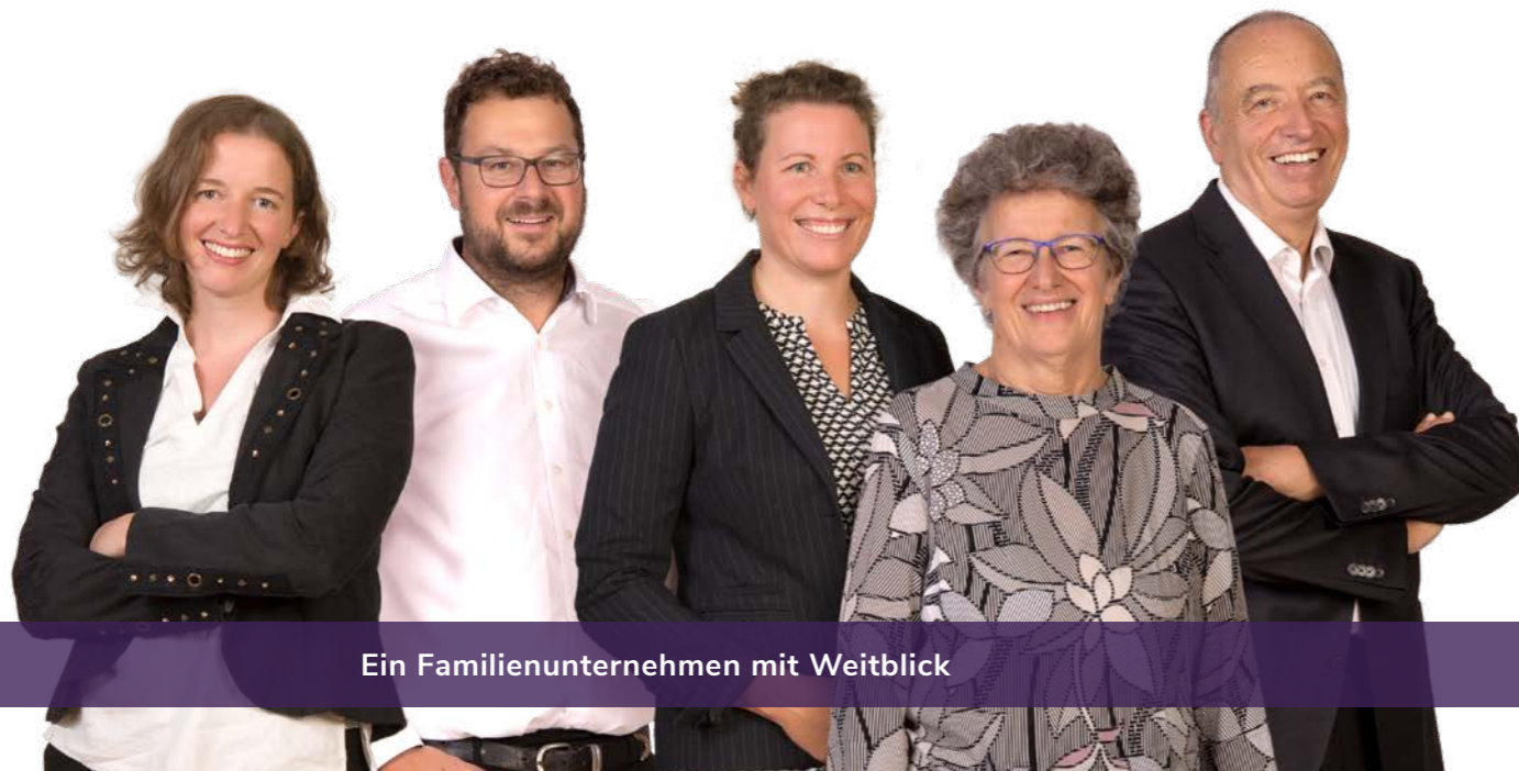
Ein Familienunternehmen mit Weitblick

Seit 1985 folgen wir dieser Vision und sind damit mehr als 30 Jahre führender Anbieter von Warehouse-Management-Systemen. Als ISO-zertifizierter Full-Service-Partner im Bereich Lagerverwaltungssysteme liefern wir das maßgeschneiderte Paket aus Hard- und Software für Ihre Anforderungen. Was uns dabei besonders auszeichnet, ist unser Blick fürs Detail. Jeder unserer über 80 Mitarbeiter ist Spezialist auf seinem Gebiet und leistet seinen Beitrag zum gemeinsamen Erfolg der CIM. Wir sehen jedes Projekt als eine neue, spannende Herausforderung: Perfekter Materialfluss begeistert uns, reibungslose Prozesse spornen uns an, konstruktive Lösungen sind unser Ziel. Über 10.000 zufriedene User weltweit sprechen eine deutliche Sprache.