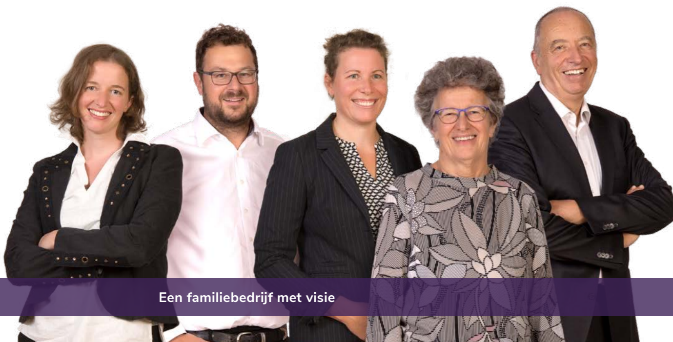
Een familiebedrijf met visie

Wij volgen deze visie al sinds 1985 en zijn daarmee al meer dan 30 jaar toonaangevend leverancier van warehouse management systemen. Als ISO-gecertificeerde fullservice-partner op het gebied van magazijnbeheersystemen leveren wij u, gebaseerd op uw wensen, een op maat gemaakt pakket van hard- en software. Wat ons daarbij onderscheidt, is onze aandacht voor detail. Elk van onze meer dan 80 medewerkers is specialist op zijn vakgebied en draagt bij tot het gezamenlijk succes van CIM. Wij zien ieder project als een nieuwe, spannende uitdaging: perfecte materiaalstromen en geoptimaliseerde processen zijn onze drijfveren, constructieve oplossingen ons doel. Meer dan 10.000 tevreden gebruikers maken wereldwijd gebruik van onze software.