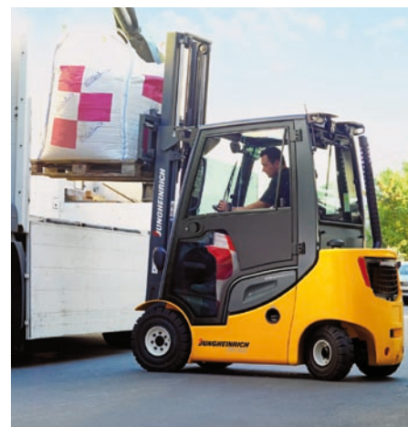
Bild 3: Beim Be- und Entladen von Lkw zeigen sich die Merkmale des hydrostatischen Antriebs in besonderer Weise

Die Verwendung von Lithium-Ionen-Akkus sorgt dafür, dass weniger Energie benötigt wird – von der Steckdose bis zum Antrieb. Zudem weisen die Lithium-Ionen-Akkus bezüglich des Lade- bzw. Entladeverhaltens eine deutliche Effizienzsteigerung im Vergleich zu herkömmlichen Bleibatte-