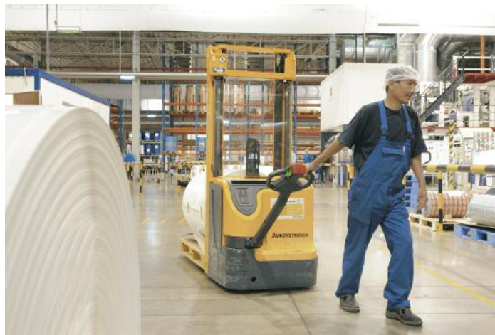
Das Rohmaterial wird von einem externen Lager in exakter Menge zur Produktion an den Alcan-Standort in Istra geliefert

Der Logistikprozess bei Alcan an sich ist denkbar einfach: Das Rohmaterial wird von einem externen Lager exakt in der Menge an den Standort Istra geliefert, wie dort benötigt wird. Nach der Verarbeitung der Materialien werden die produzierten Güter am Standort zunächst zwischengelagert, bevor sie in ein Distributionszentrum transportiert werden. Von hieraus erfolgt die