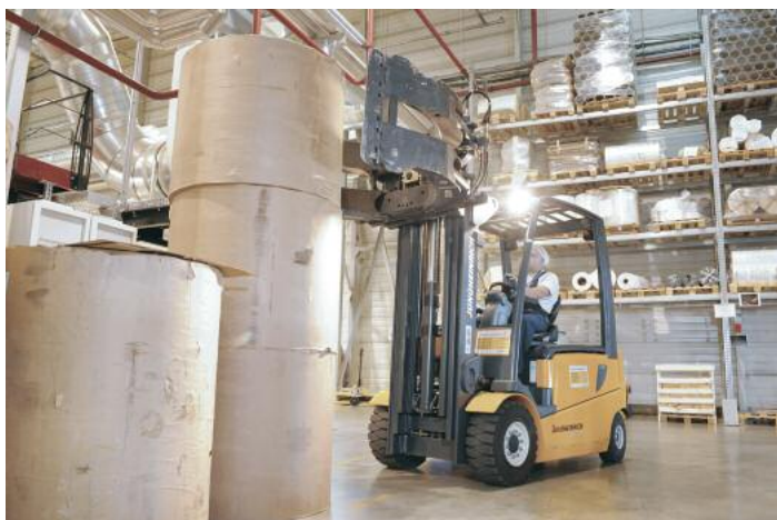
Die Mietstapler von Jungheinrich sorgen für die logistische und die finanzielle Flexibilität von Alcan

te und Gebrauchtgeräte bei Jungheinrich Russland. Mit der Mietrate sind nach Worten des Managers beispielsweise Zinsen, Abschreibungen, Versicherungsprämien und Servicekosten bereits abgedeckt. Zudem ist die Mehrzahl der Fahrzeuge in den Jungheinrich-Mietflotten jünger als ein Jahr, sodass der Kunde stets die aktuellste Technik zur Verfügung habe.