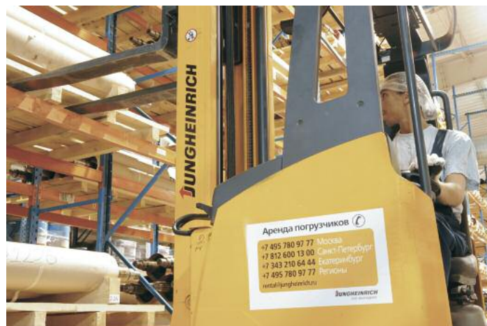
Jungheinrich als produzierender Dienstleister setzt auch in Russland auf einen guten Service – und gute Produkte