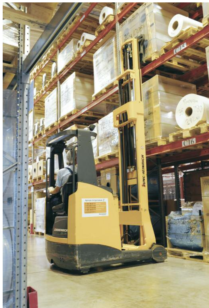
Nach der Verarbeitung werden die Produkte am Standort zunächst zwischengelagert, bevor sie über ein Distributionszentrum an den Kunden gehen

„Das Angebot von Jungheinrich ist für uns eine sehr wirtschaftliche Lösung mit äußerst günstigen Zahlungsbedingungen“, unter-