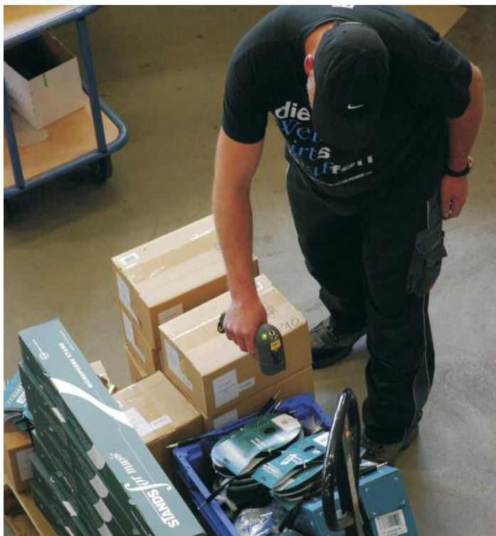
Warenausgangserfassung beim Handelsunternehmen Adam Hall mit Laserscanner Motorola LS3678ER