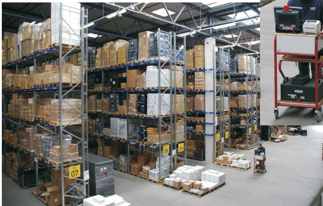
Das 2008 eröffnete Logistikzentrum von Adam Hall in Neu-Anspach. Vergrößert ein mobiler Arbeitsplatz mit Dlog-Computer und Zebra-Drucker. Die IT-Lösung implementierte ICS