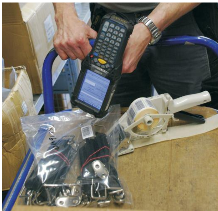
Mobilcomputer Motorola MC9090-G mit Scanner für die mobile Datenerfassung aller gängigen eindimensionalen Codes