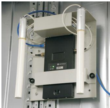
AP300 Access-Port mit externen Antennen ist Teil des ‚Motorola Wireless Switch Systems‘

Im Lager bringt die neue Datenfunklösung bereits heute eine ganze Reihe von Prozessverbesserungen mit sich. So können mehrere Aufträge für denselben Empfänger in ein einziges Paket gepackt werden. Diese Zusammenführung erlaubt einen sehr viel effizienteren Packprozess. Über sein Datenfunkterminal bekommt der Packer angezeigt, wie viele Aufträge an den jeweiligen Empfänger ausgeliefert werden sollen. Ebenso kann ein Auftrag je nach Lagerbereich in bis zu drei verschiedene Teile aufgesplittet werden, sodass bis zu drei Mitarbeiter an einem einzigen