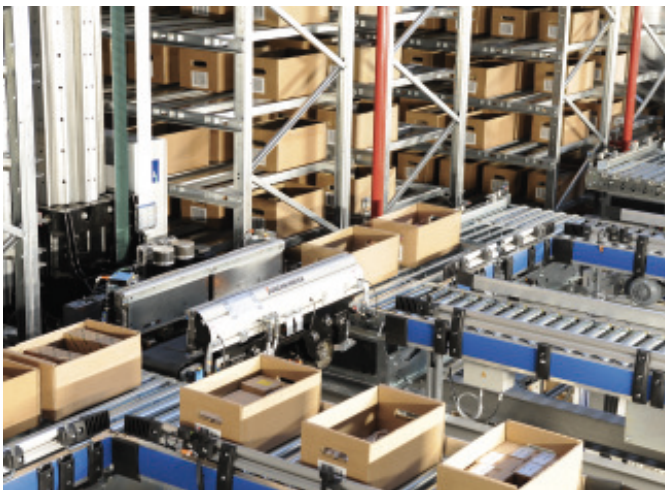
Bild 2 Im automatischen Kartonlager mit rd. 160 000 Stellplätzen kommt es auf Schnelligkeit an, da etwa 80 % aller Lagerzugriffe für die Kommissionierung hierüber abgewickelt werden.

an den kombinierten Kommissionierplätzen bereits erheblich