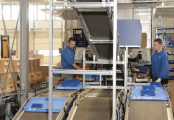
Bild 4 An den zehn multifunktionalen Kommissionier-Arbeitsplätzen können sowohl Kanban-Aufträge in verschiedene Kundenbehälter ...