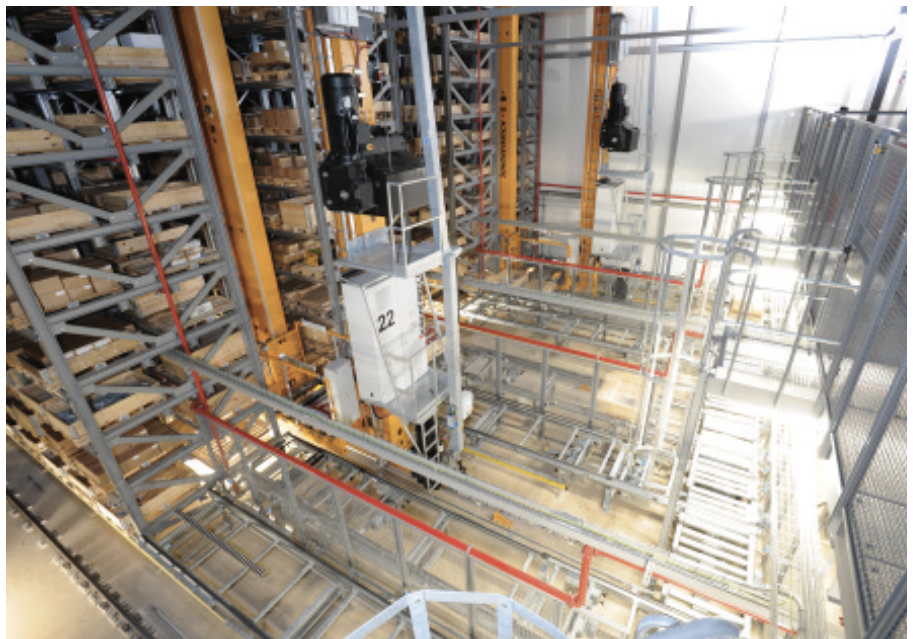
Bild 1 Das fünf-gassige automatische Palettenhochregallager dient als Nachschublager sowie als Kommissionierlager für große Auftragspositionen.

Das bisherige Zentrallager in Unterschleißheim bei München entsprach mit seinen 9 000 Palettenstellplätzen und etwa