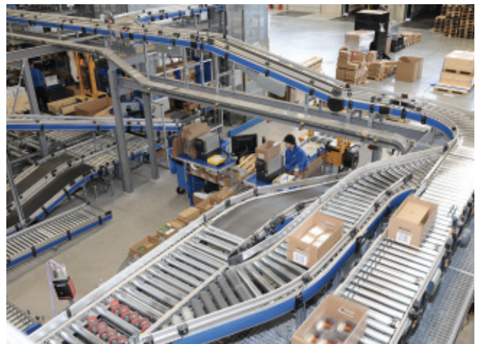
Bild 3 Die Paletten, Kartons und Tablare mit den Kanban-Behältern werden über Fördertechnik auf mehreren Ebenen zu den Kommissionier-Arbeitsplätzen transportiert.