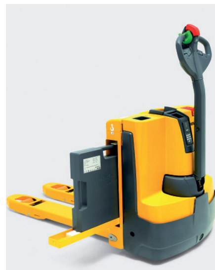
Bild 3 Bei den Elektro-Staplern setzt Jungheinrich längerfristig auf die Lithium-Ionen-Batterie.

Im Bereich seiner Diesel- und Treibgasstapler befindet sich nun auch ein „großer“ Hydrostat mit Tragfähigkeiten