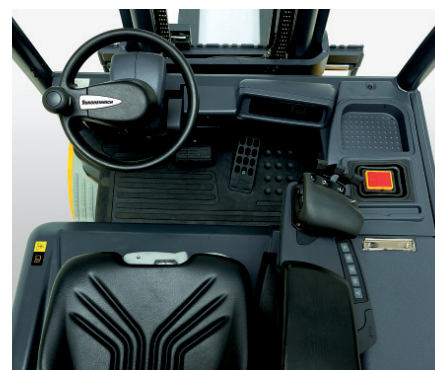
Bild 4 Der Elektro-Gegengewichtsstapler EFG 425 hat einen neu gestalteten Arbeitsplatz mit vielen Ablageflächen bekommen.

bis 5,5 t im Portfolio. Im Special zur LogiMAT wird der VFG 5402–550s (Bild 5), der demnächst erhältlich sein wird, etwas eingehender beschrieben. VU