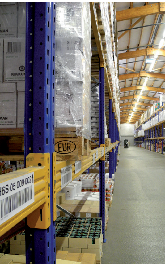
Bild 2 Das Logistikzentrum der Lagerhäuser Aarau ist in allen Arbeitsbereichen klar strukturiert.