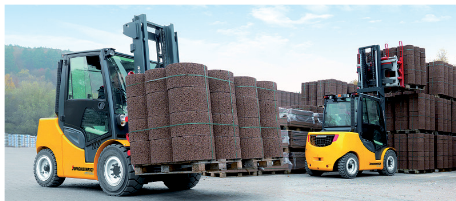
Bild 5 Mit dem VFG 540s-550s hat Jungheinrich seine hydrostatisch angetriebene verbrennungsmotorische Stapler-Serie nach oben hin ausgebaut.

bis 5,5 t im Portfolio. Im Special zur LogiMAT wird der VFG 5402–550s (Bild 5), der demnächst erhältlich sein wird, etwas eingehender beschrieben. VU