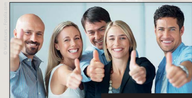
DAS KBU TEAM