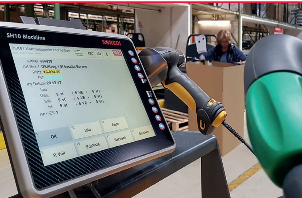
Übersichtliche Staplerdialoge ermöglichen eine effiziente und fehlerfreie Kommissionierung.