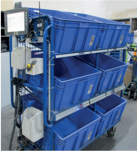
Sanitop-Wingenroth nutzt bei ihrer Multi-Channel-Logistik Kommissionierwagen mit Puto-Light.

Mit ProStore® perfekt gerüstet für Multi-Channel-Logistik