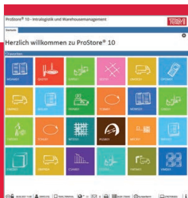
Die Oberfläche von ProStore® präsentiert sich übersichtlich und aufgeräumt.

Diese und alle weiteren Module von ProStore® sind auf Logistik 4.0 ausgerichtet und unterstützen sämtliche Komponenten der Digitalisierung im Lager.