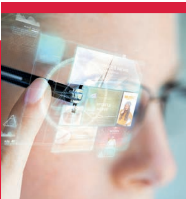
Pick-by-Vision-Lösungen erleichtern Kommissionier-Tätigkeiten und sorgen für effizienteres Arbeiten.

Bei Bedarf kann eine Hochverfügbarkeit an 365 Tagen im Jahr sichergestellt werden.