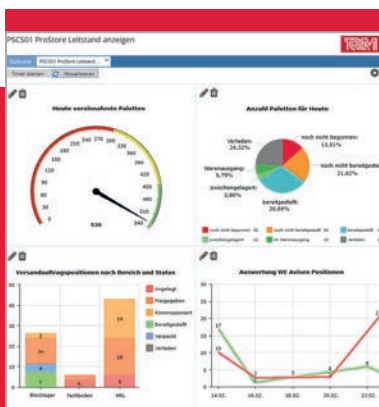
Im Leitstand wird die Auslastung in Echtzeit visualisiert. Planabweichungen sind sofort korrigierbar.