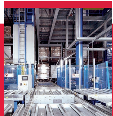
Die Integration von automatischen Systemen erhöht die Produktivität der Anwendung.

Flexibilität, Modularität und Skalierbarkeit