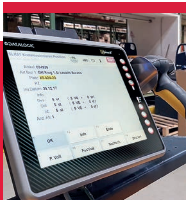
Das integrierte Staplerleitsystem mit modernen Funkterminals verkürzt Wege und optimiert Abläufe.