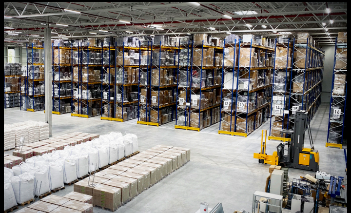
Digitalisierte Prozesse und Lagerung in großen Höhen. Benutzerfreundliches Arbeiten mit dem Jungheinrich WMS.