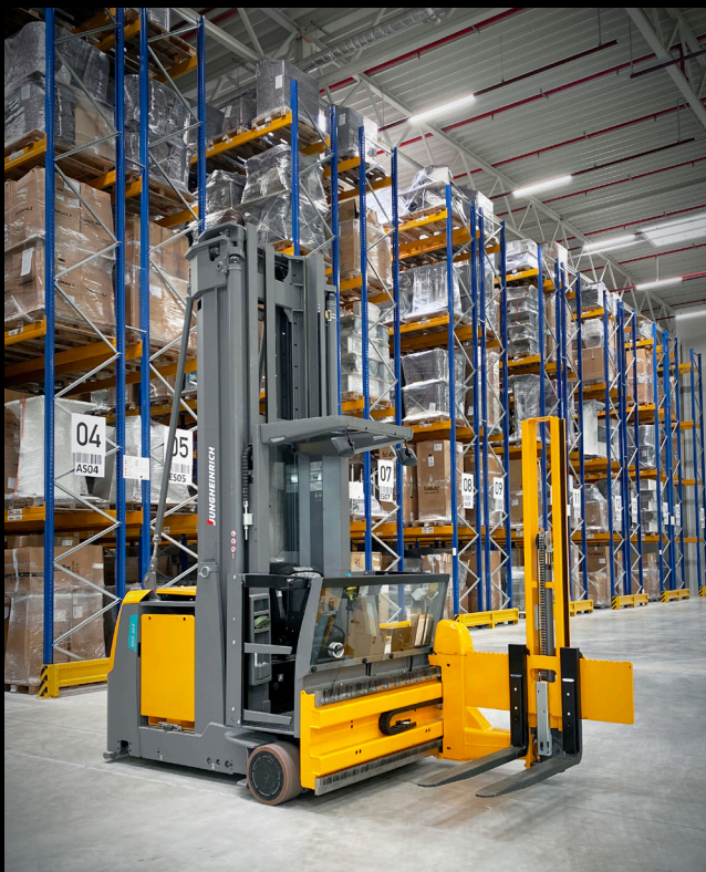
Schmalganglager mit warehouseNavigation komplett ausgestattet von Jungheinrich.