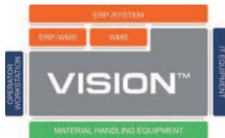
Die Software stellt Module für die Grundfunktionen der Intralogistik zur Verfügung.

ximale Systemstabilität, kurze Implementierungszeiten sowie an die System-Performance bestehen. Mit VISION™ wird eine ausge-reifte Softwarelösung ange-boten, die den genannten Anforderungen in allen Bel-angen gerecht wird. VISION™ stellt dem Benutzer die Grundfunktionen zur Verfü-gung, um die Prozesse der Intralogistik opti-mal auszuführen, zu managen, zu steuern und in eine vorgegebene Infrastrukt-ur zu integrieren. Auf dieser Basis sind weitere Produkte verfügbar, die entweder als eigenständige Sys-teme über Konfigurationen implementiert oder in komplexen Systemen miteinander kombiniert werden können. Die Produkte wie etwa VISION™.ODS, VISION™.CPS und VI-SION™.ZPS sind Komplettlösungen für die Kommissionierung. Sie ermöglichen eine fle-xible Gestaltung kundenspezifischer Ge-schäftsprozesse durch 100%-ige Anpassung des Systems – moved by VISION™.