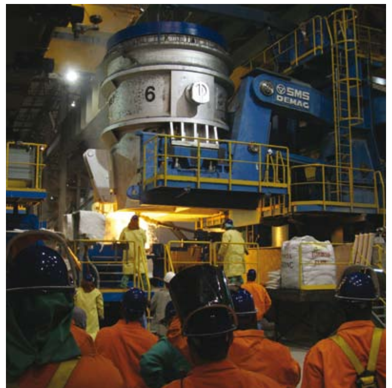
PSI Kollegen live vor Ort beim ersten Abguss am Caster. Mittelfristig produziert SeverCorr 1,5 Mio. Tonnen Stahl pro Jahr.

Die besondere Inbetriebnahmesituation wurde von allen Seiten bestens bewältigt: Pünktlich zum Produktionsstart arbeiten die