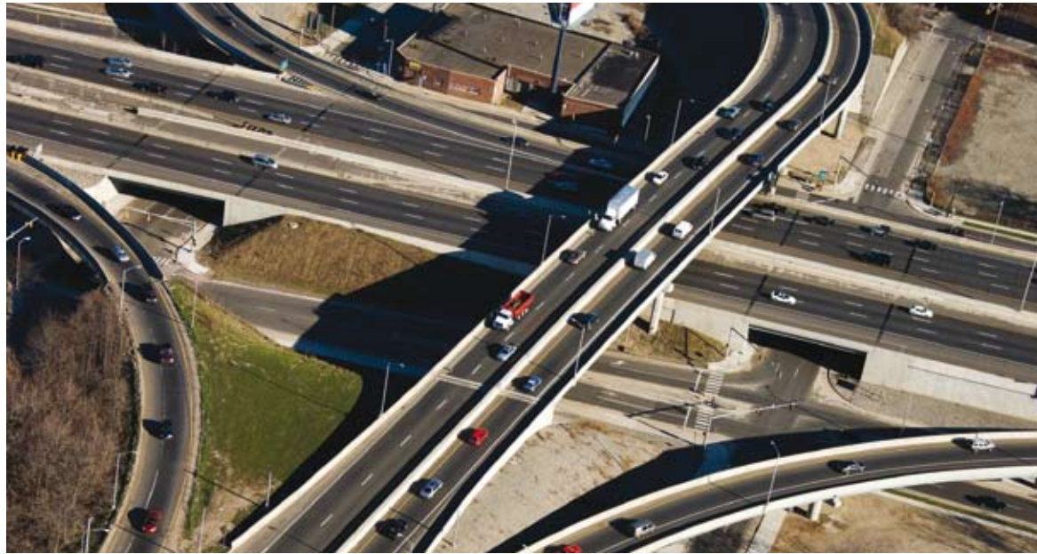
PSITms zur prozessorientierten Planung, Disposition und Durchführung aller in einem logistischen Netzwerk anfallenden Transporte.

Denn das Transport Management System für regions- und standortübergreifendes Auftragsmanagement, für Disposition, Controlling und Monitoring unterstützt nicht nur die Planung und Steuerung der operativen Prozesse und Ressourcen. Als leistungsstarke, modular konzipierte Lösung mit dem Charakter eines Individualsystems erschließt PSITms zudem Einsparpotenziale auch bei dynamischen Planungskomponenten. So lassen sich kurzfristig beispielsweise neue Kundenaufträge und -anforderungen optimal in zyklische Auslieferungstouren integrieren.