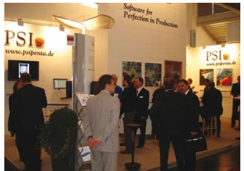
Den neuen PSIPENTA Messestand sehen Sie auf der IT'nT, CeBIT und Digital Factory.

Weitere Informationen und Veranstaltungen finden Sie im Internet unter http://www.psi.de .