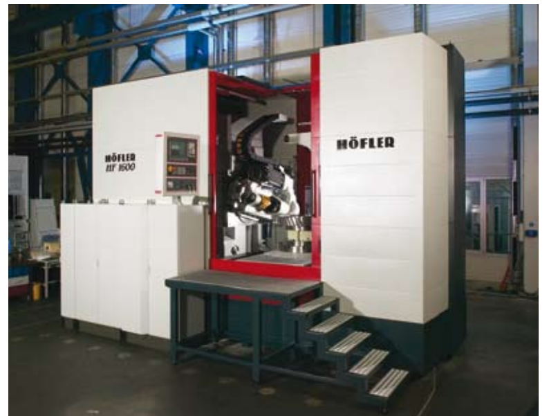
Seit 2003 fertigt HÖFLER Zahnradfräsmaschinen - hier die HF 1600.

Dazu kommt eine hohe Flexibilität in der Anpassung. Mit Visual Basic lassen sich alle Arten von Plausibilitäten in das System einbauen. Das verhindert, dass fehlerhafte Daten eingegeben werden, etwa bei der Kontierung. So haben seltene, nicht regelmäßig gebaute Exoten keinen eigenen Artikelstamm und auch kein Bestandskonto. Für diesen Fall hat man Tabellen eingebaut, in