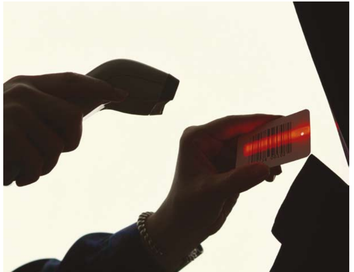
PSIBde-mobile: Unternehmensdaten in Echtzeit.

Die Datenerfassung mit mobilen Geräten verschiedenster Art ermöglicht die zeitgenaue Buchung dort, wo sie entsteht. Da die Lösung zu allen stationären Erfas-