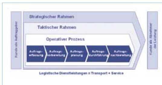
PSITms-Referenzmodell für Transport und Services

Das muss nicht sein. Mit dem neuen Transport Management System PSITms der PSI Logistics sind solche zeitaufwändigen Planungen jetzt nahezu per Mausklick erledigt.